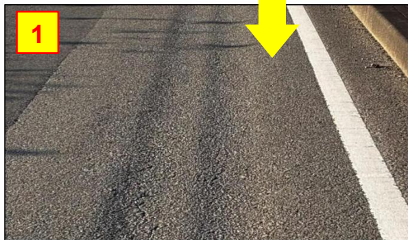
《路面の段差 (わだち)》

「走行注意」 ・ 進行方向に約30m、2車線の右側に段差があります。 ・ コース試走時に確認してください。