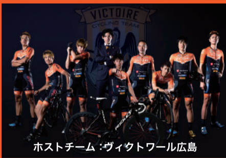
ホストチーム：ヴィクトワール広島

問合せ：広島クリテリウム事務局 TEL:082-521-4736 info@victoirehiroshima.com