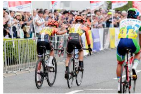
昨年は約7,000人が声援を送りました