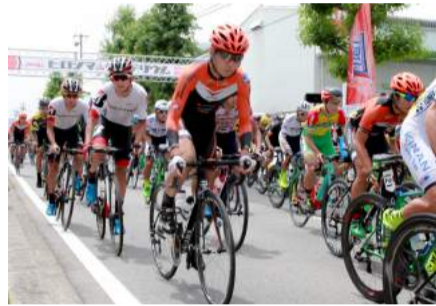
約100人が一斉にスタート

Jプロ: プロ選手が出場する最上級カテゴリ エリート: 連盟に登録しているアマチュア選手が出場するカテゴリ。 年間チームランキング上位に入るとプロ昇格のチャンスを得ることができる フェミニン: 女性のみで戦うカテゴリ